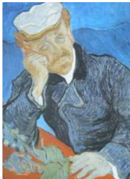
Vincent Van Gogh : Portrait du docteur Gachet

Se sentant guéri, il a hâte de rejoindre Paris. Pour sa convalescence il est accueilli par le docteur Gachet à Auvers sur Oise