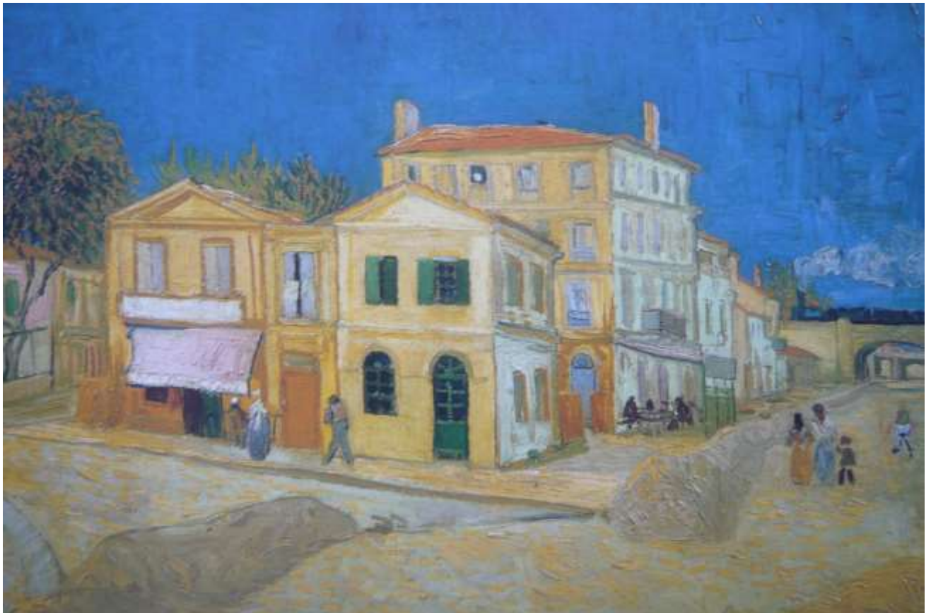
Vincent Van Gogh : La Maison Jaune

Seul Paul le suivra dans l'aventure, Paul qui cherche sans fin à trouver un lieu au plus loin de la « civilisation » sclérosante et étouffante.