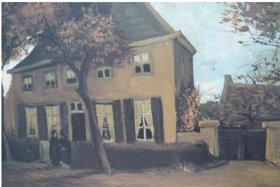
Vincent Van Gogh Nuenen

Son petit frère, Théo sera, lui, marchand de tableau, en charge, notamment, de vendre les toiles de Gauguin.