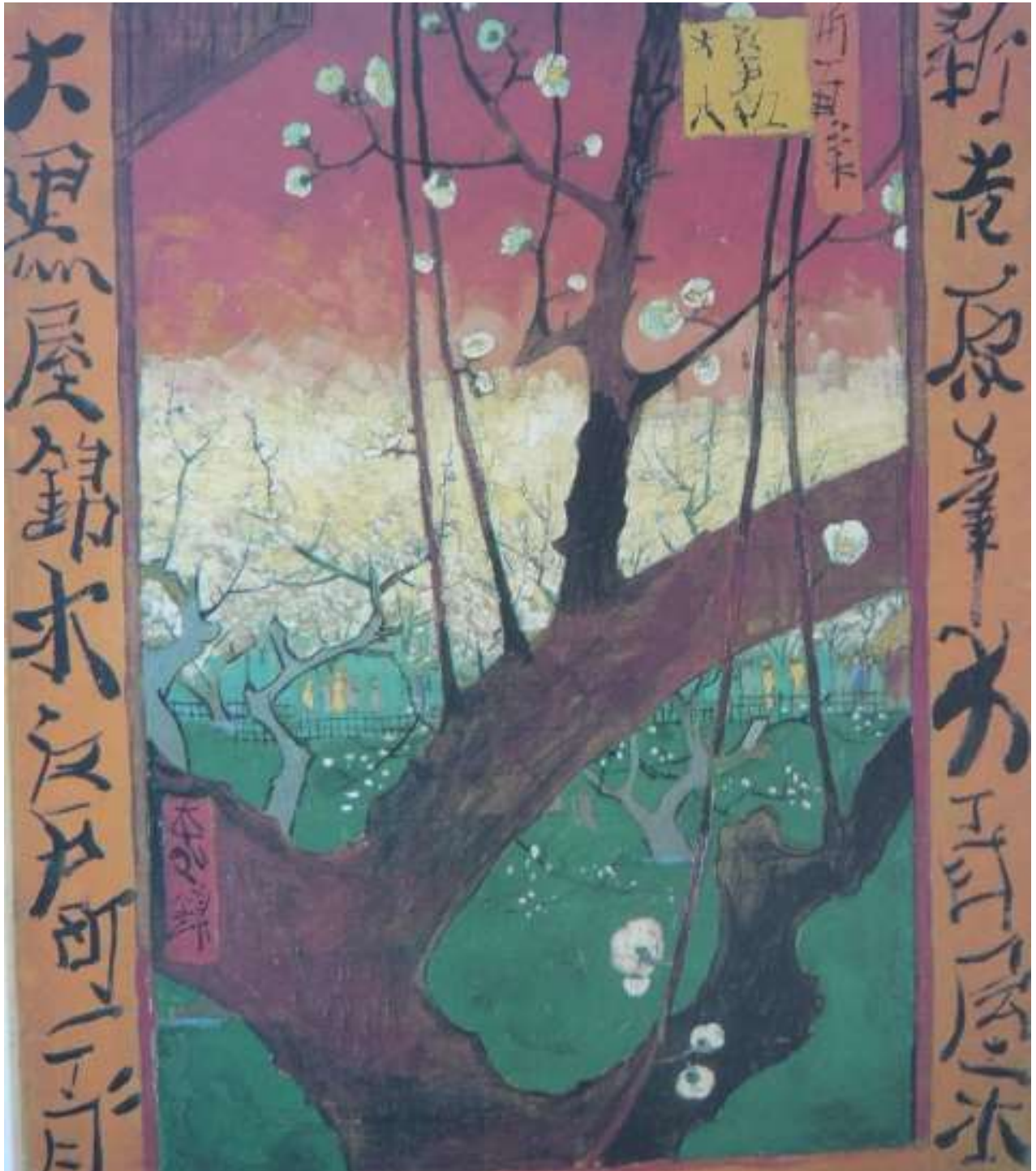
Vincent van Gogh :Japonaiserie d'après Hiroshige

Vincent, à l'évidence, s'en inspire avec talent.