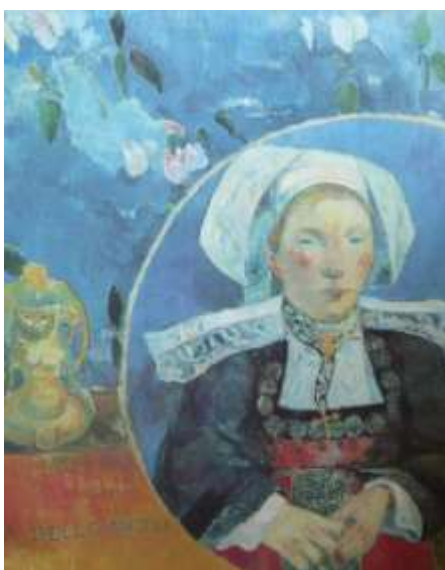
Paul Gauguin : la Belle Angèle

Ayant abandonné son premier métier pour se consacrer entièrement à son art (au grand dam de Mette son épouse qui n'arrive plus à faire vivre dignement sa maisonnée), il va installer son chevalet en Bretagne, à Pont Aven, où les peintres sont nombreux et les auberges accueillantes.