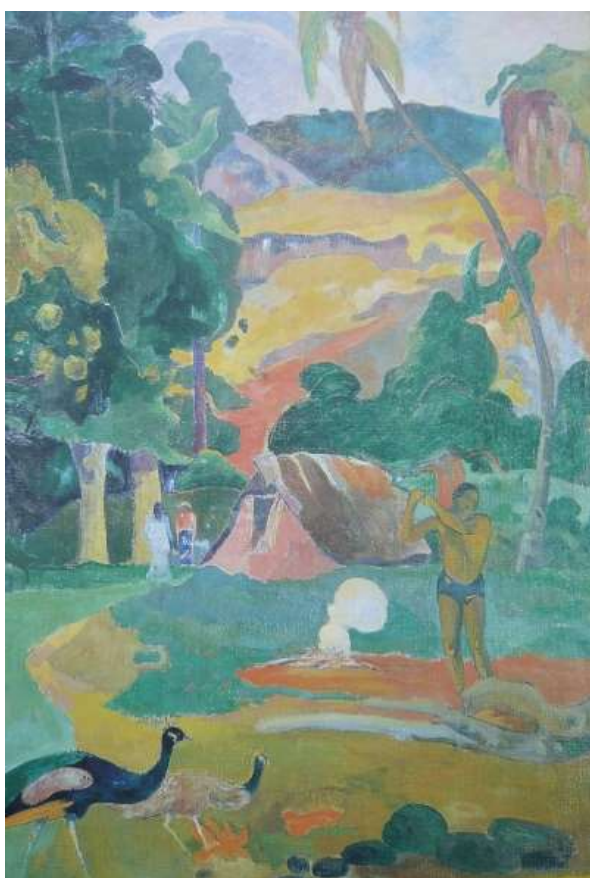
Paul Gauguin : Paysage au paon.

Paul fuit la France en 1891 et ne reviendra que pour un court séjour en 1893. Il s'installe d'abord à Tahiti, puis s'enfonce toujours plus loin, dans les îles les plus reculées.