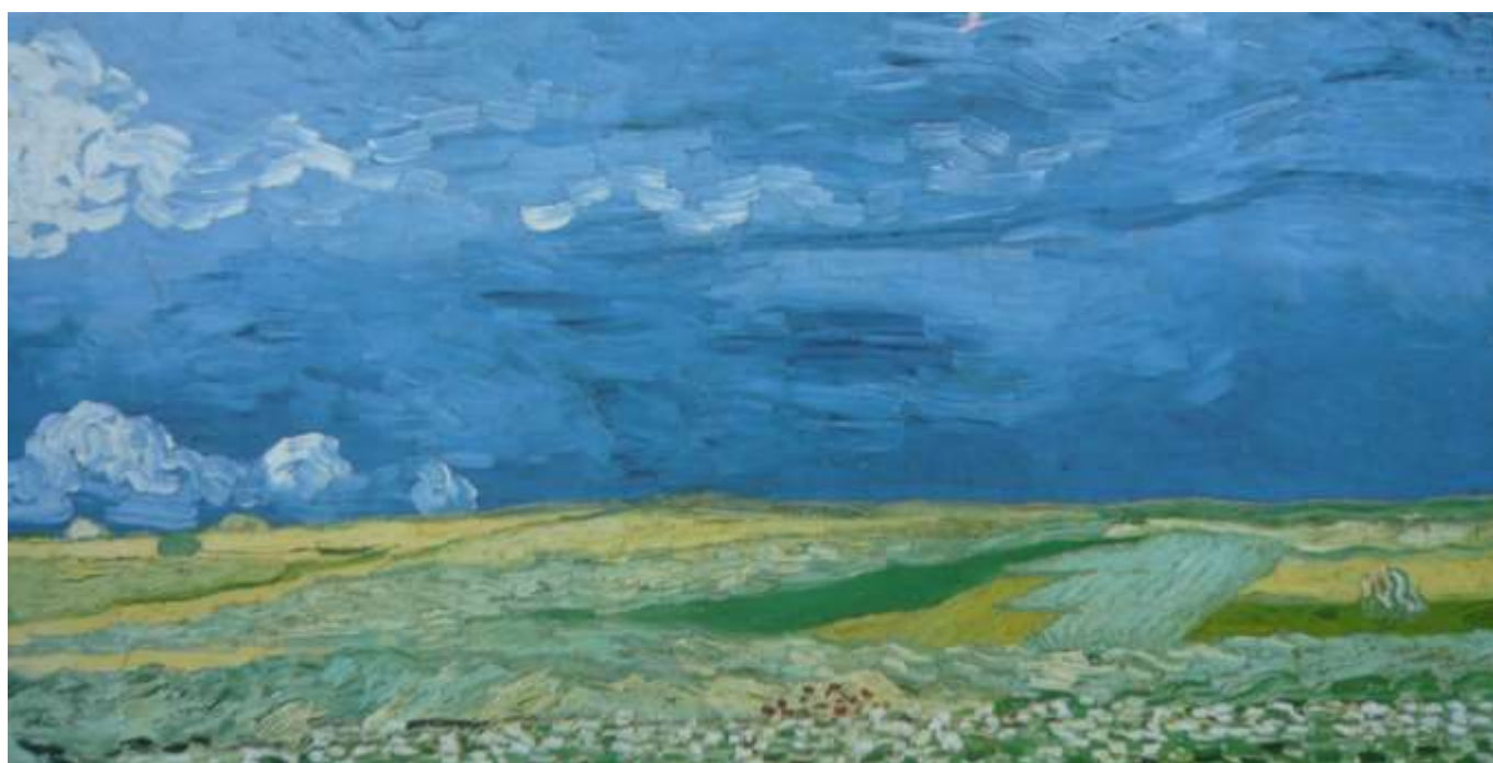
Vincent van Gogh Champ de blé, ciel orageux

Les comparer est un exercice difficile mais passionnant.