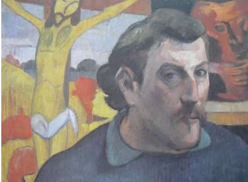
Paul Gauguin (1848-1903) Autoportrait au Christ jaune