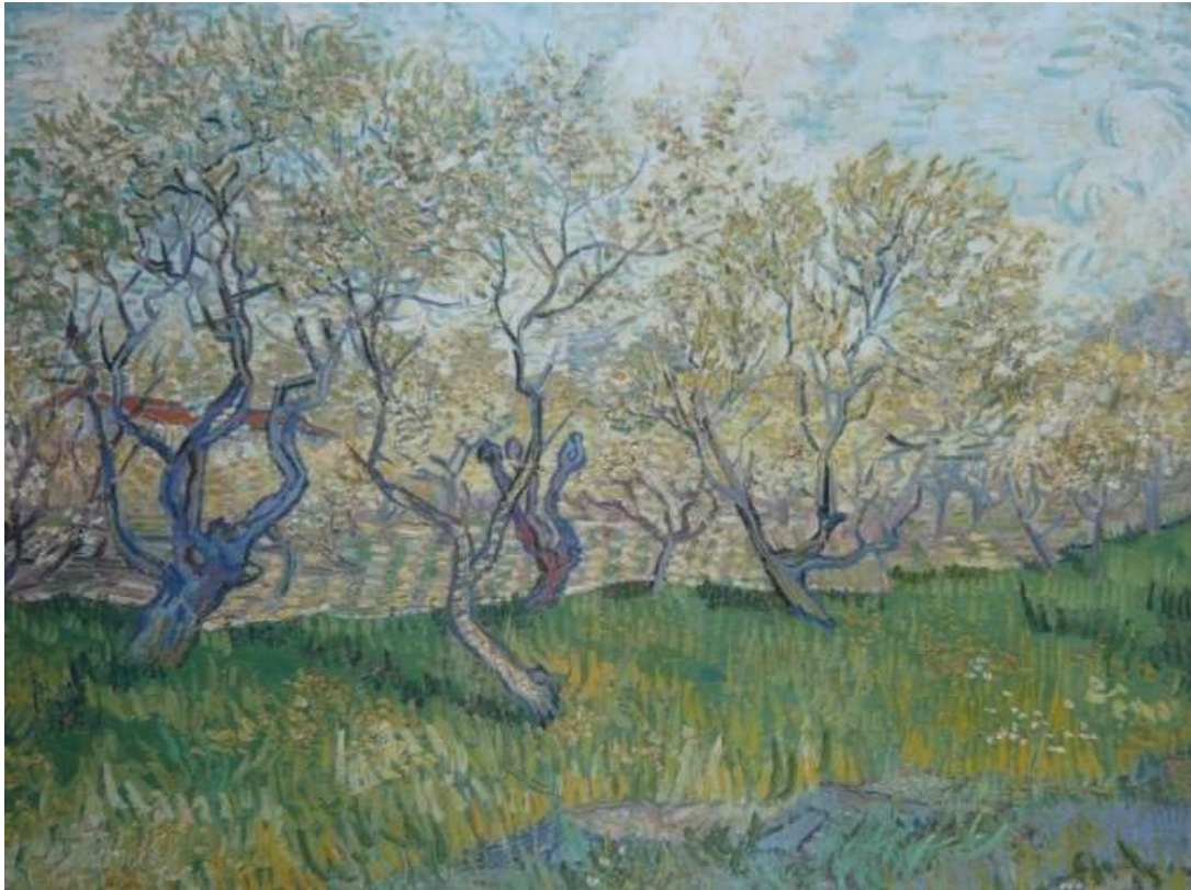
Vincent Van Gogh Vergers en fleurs

Vincent demande son internement à l'hôpital de Saint Rémy où il séjourne de longs mois.