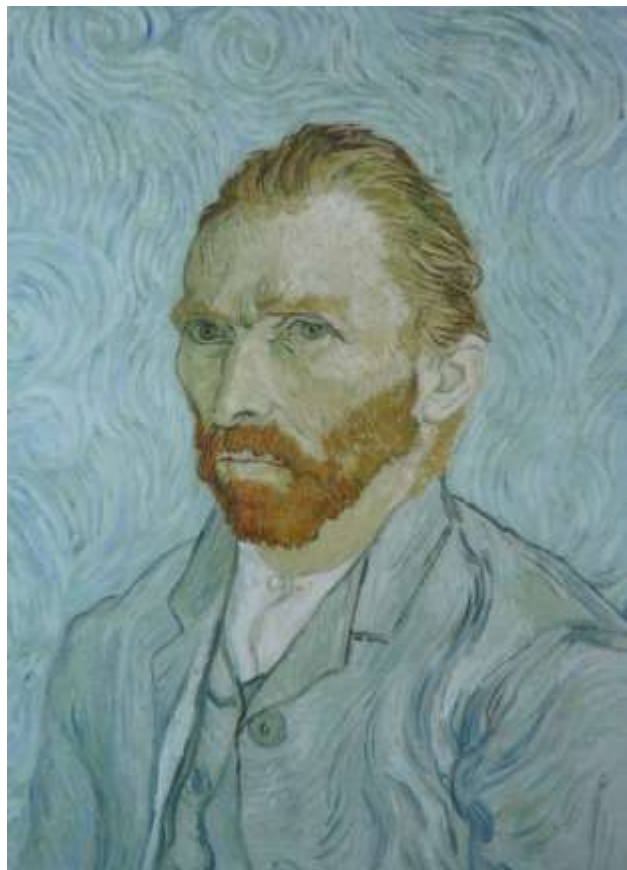
Vincent van Gogh (1853 1890) Autoportrait