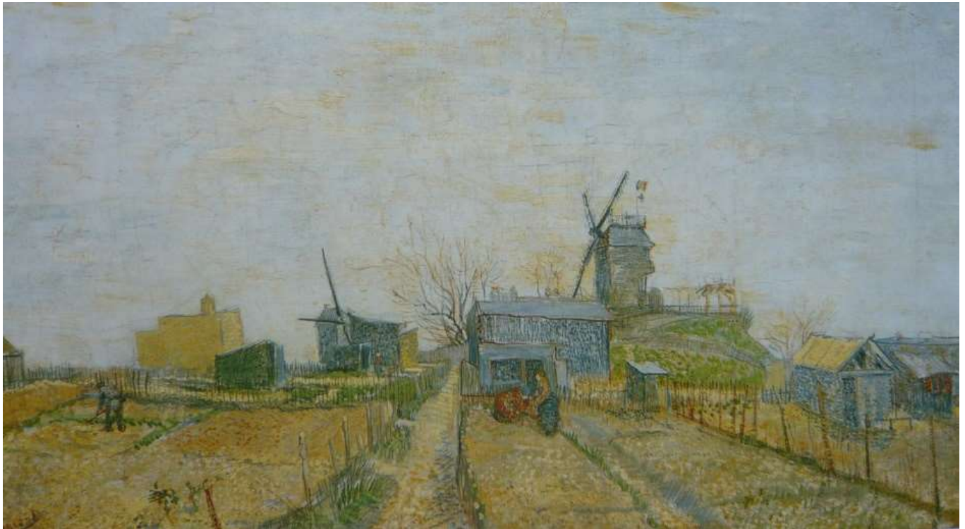
Vincent Van Gogh : Jardins potagers à Montmartre et Moulins

En découvrant la peinture Impressionniste, il éclaircit sa palette définitivement et peint sur le motif des vues de la Butte Montmartre, telle qu'elle était dans les années 1880...encore investie par la culture du blé et sommée par les Moulins en charge de transformer le grain en farine.