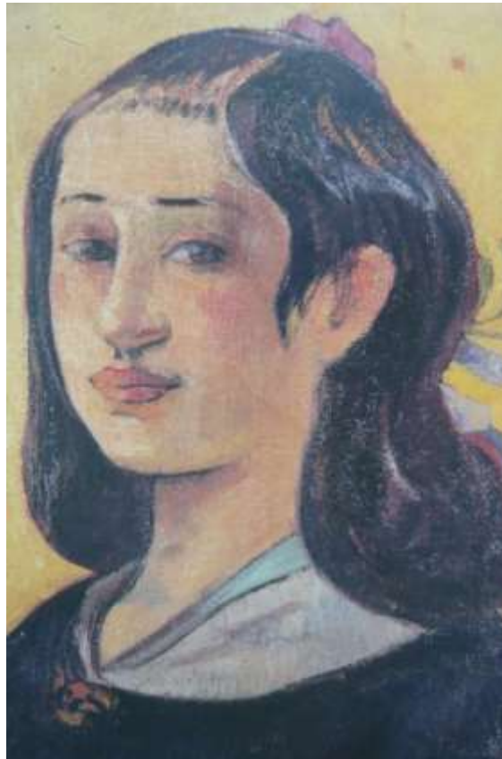
Paul Gauguin : la Mère de l'artiste

Si son père de Paul est mort très jeune, laissant sa mère Aline veuve, le jeune garçon n'a pas eu une enfance malheureuse, et il passe ses premières années à Lima où vivent ses grands-parents.