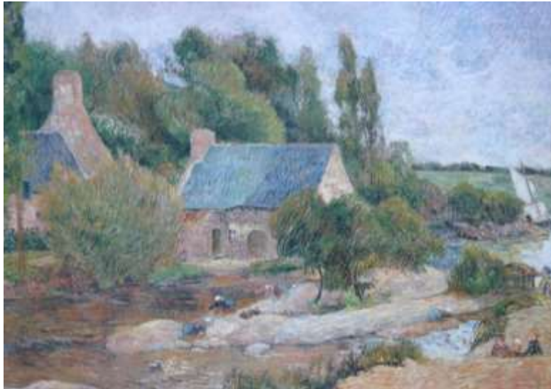
Paul Gauguin : Les lavandières à Pont Aven

Paul commence une carrière chez un agent de change .Il est marié à Mette Gad, danoise, et ils vivent assez confortablement avec leurs enfants .Paul collectionne d'ailleurs des tableaux « modernes » et quand il commence à peindre, il est inspiré par l'Impressionnisme.