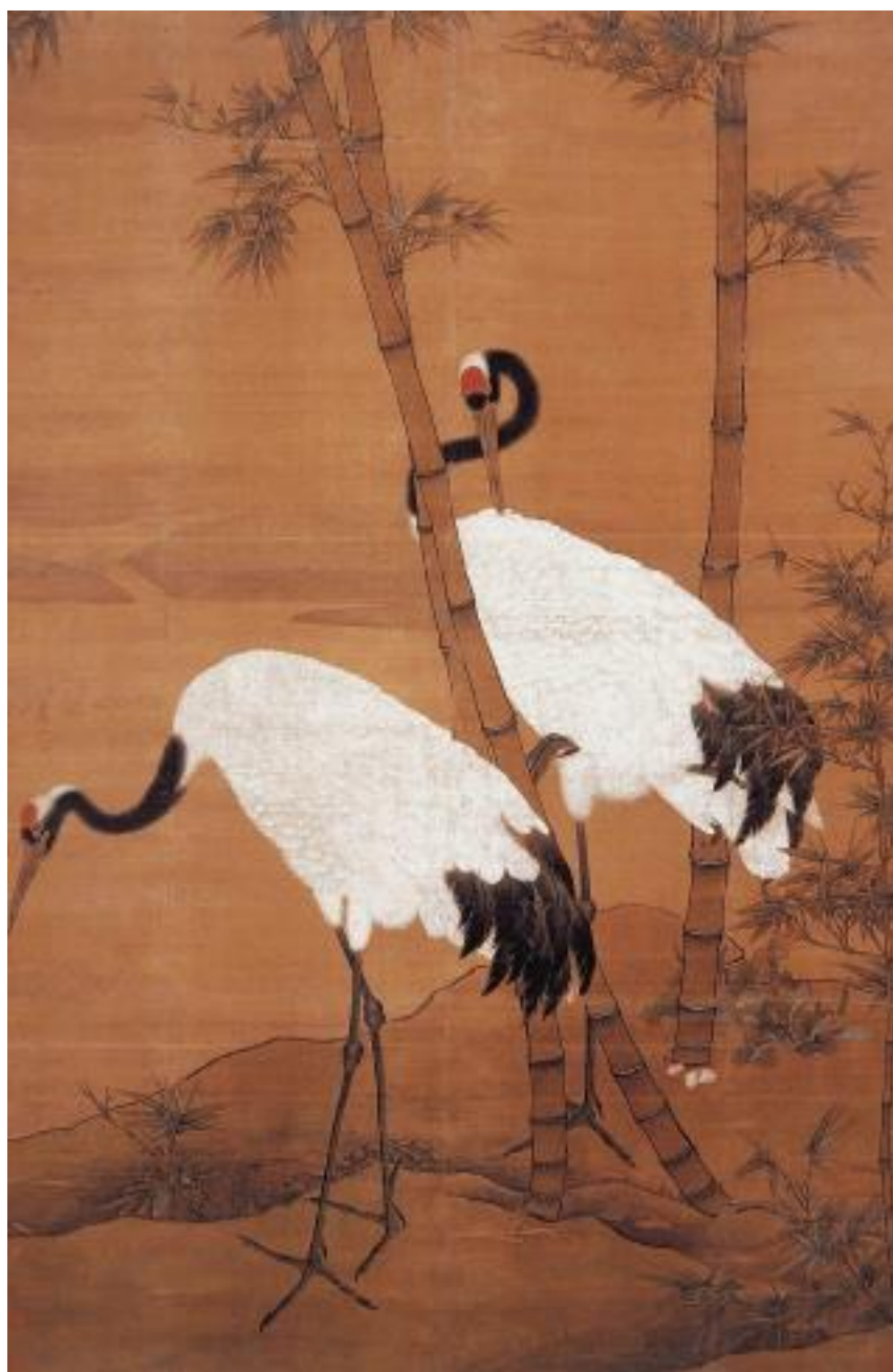
Bian Jingzhao. Bamboo and Cranes . © Palace Museum, Beijing