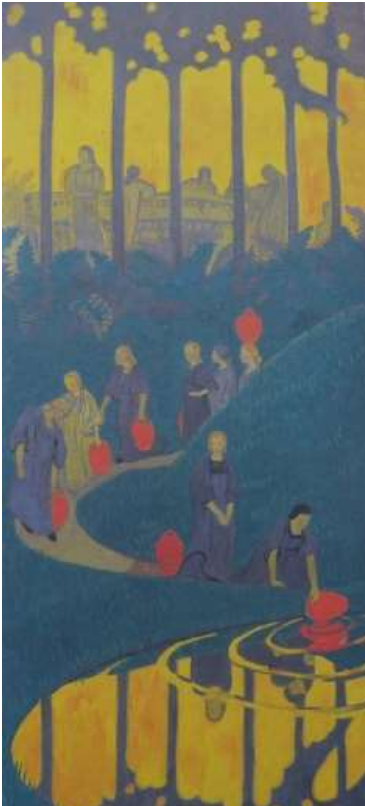
Paul Sérusier : Femmes à la source

Certains artistes du groupe nabi sont particulièrement intéressés par les sujets symbolistes qu'ils transposent dans leurs décors.