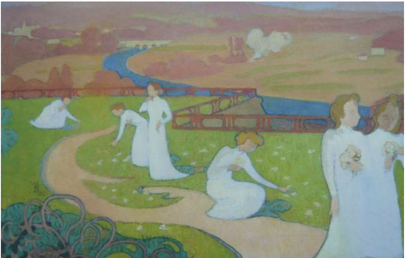
Maurice Denis : Avril

La femme y apparaît délicate et ingénue, dans un environnement poétique et bucolique.