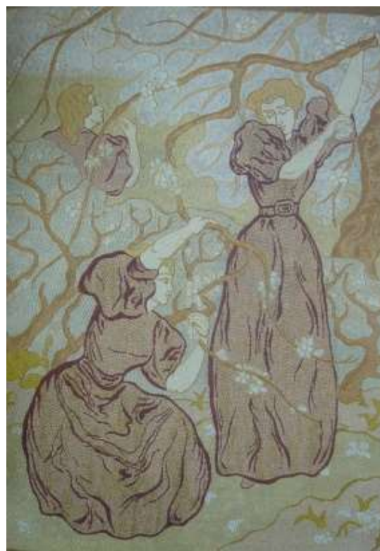
Paul Elie Ranson : Le Printemps (tapisserie à l'aiguille)