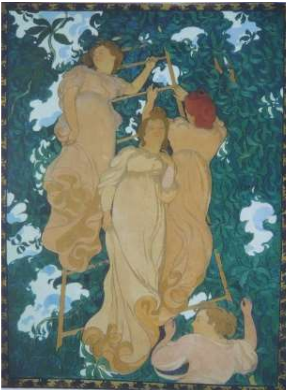
Maurice Denis ; Arabesque poétique.

Quand Sérusier crée ce décor pour son ami nabi, le sculpteur Georges Lacombe, il s'appuie sur le principe du « Nombre d'or », une formule mathématique qu'il a étudiée à l'abbaye de Beuron en Allemagne.