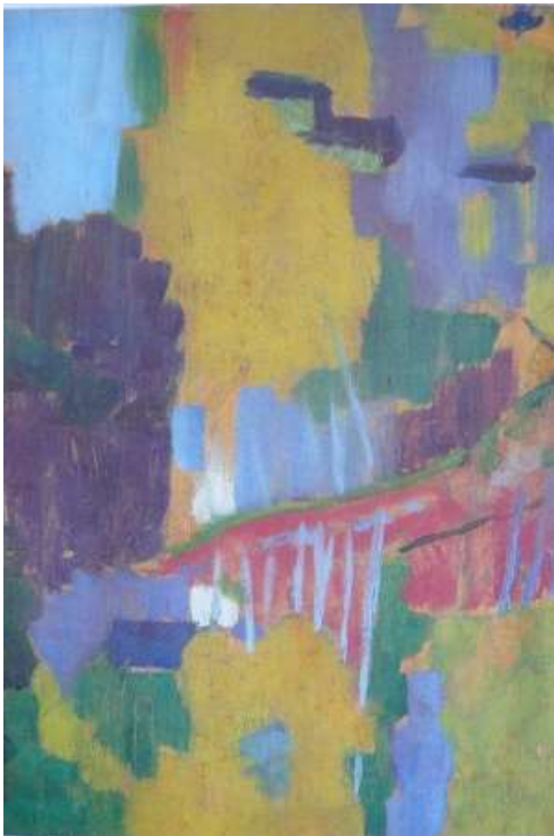
Paul Sérusier Le Talisman

A la fin des années 1880, de jeunes artistes fascinés par la peinture de Paul Gauguin, se regroupent sous le nom de Nabis (mot qui signifie « prophète » en hébreu) car leur ambition est de révéler un art nouveau.