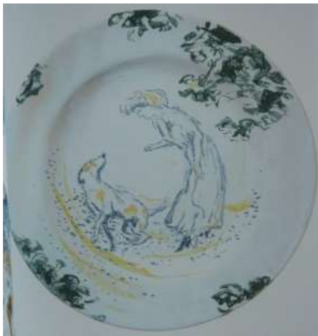
Pierre Bonnard : Femme au chien

On décore assiettes, abat-jours, tentures