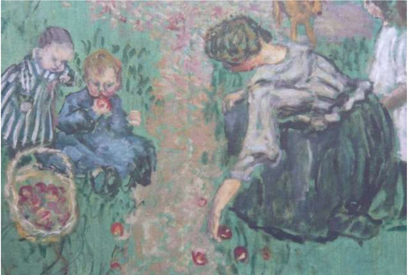
Pierre Bonnard La cueillette des pommes