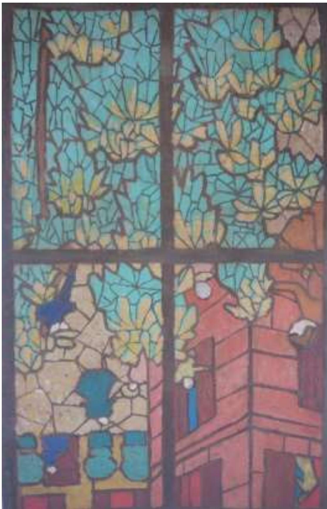
Edouard Vuillard : Marronnier